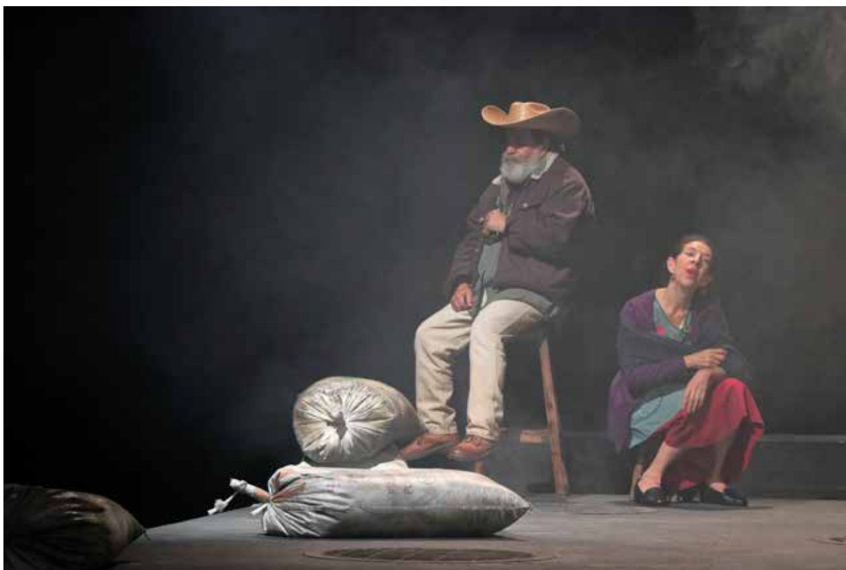
Cherán o la democracia según cinco indias rijosas (2019).