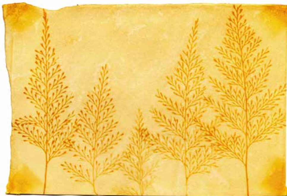
Derrick Méndez Rebolledo: Sin título

El paisaje interior de que habla el dictamen radica justamente