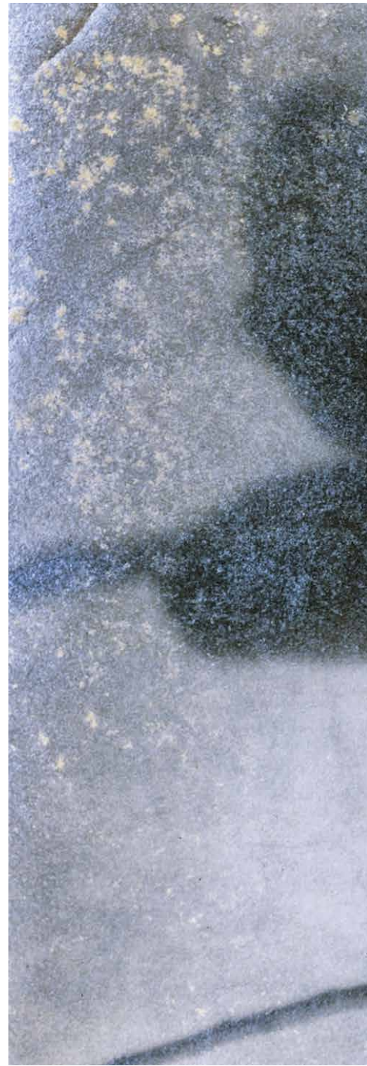
Sin título, ca. 1920. Col. Museo de la Fotografía, Moscú