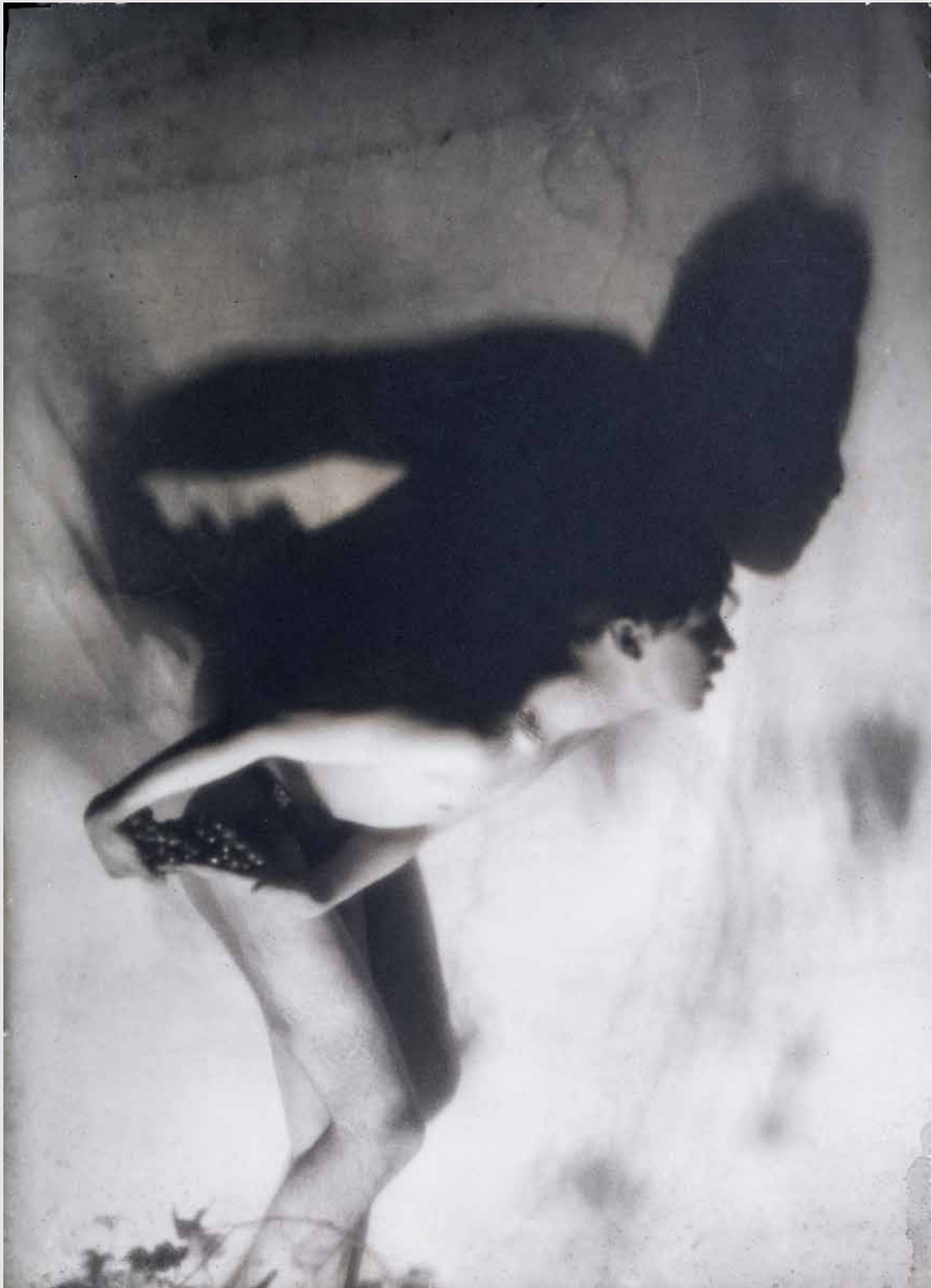
Sin título, ca. 1920.