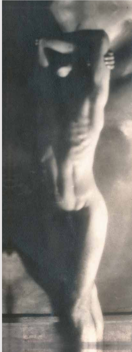
Sin título, ca. 1920. Col. Museo de la Fotografía, Moscú