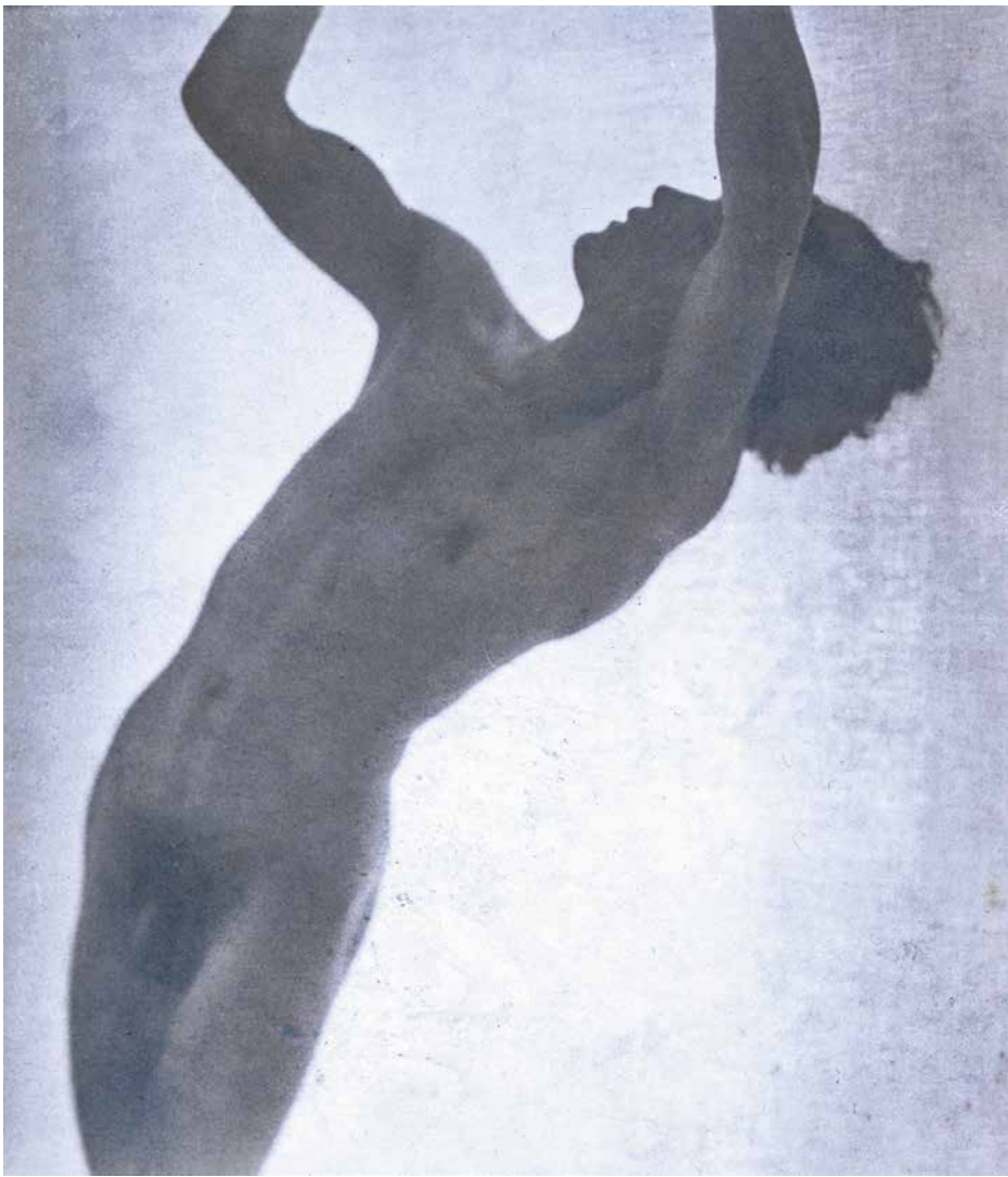
Sin título, ca. 1920. Col. Museo de la Fotografía, Moscú