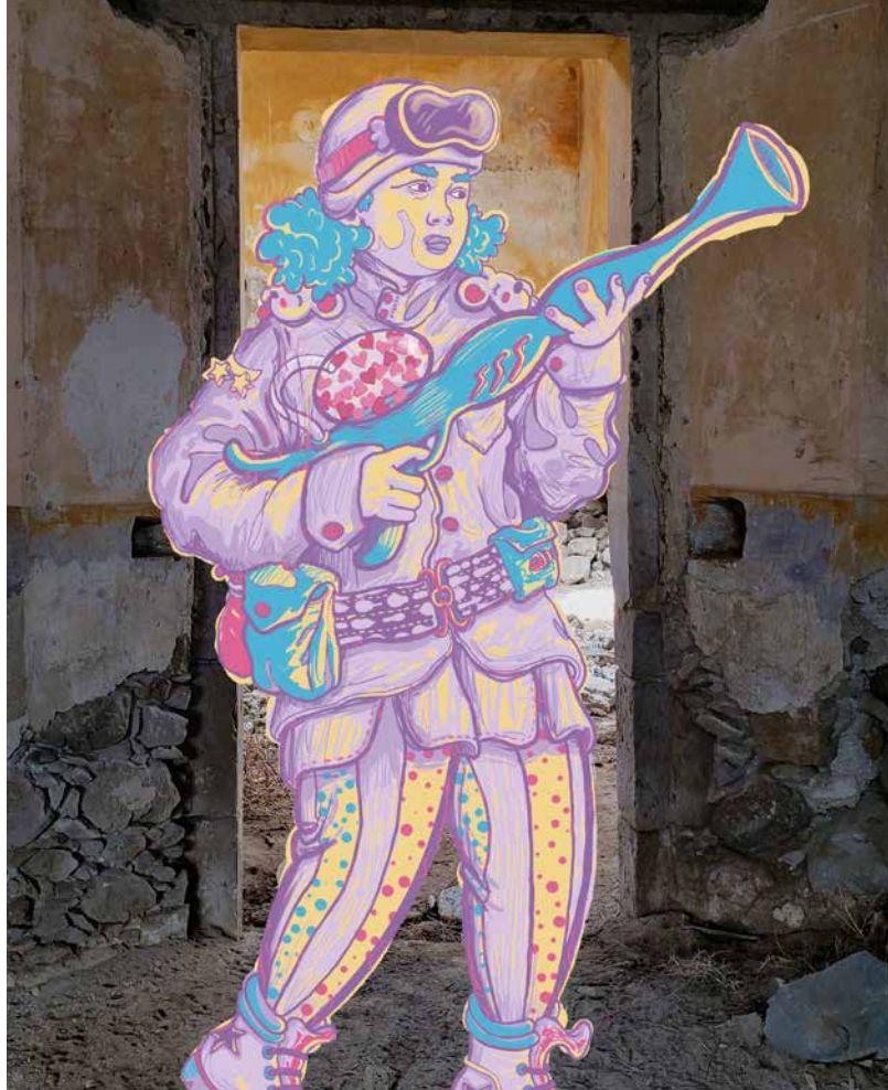
Antilope: Las armas del amor