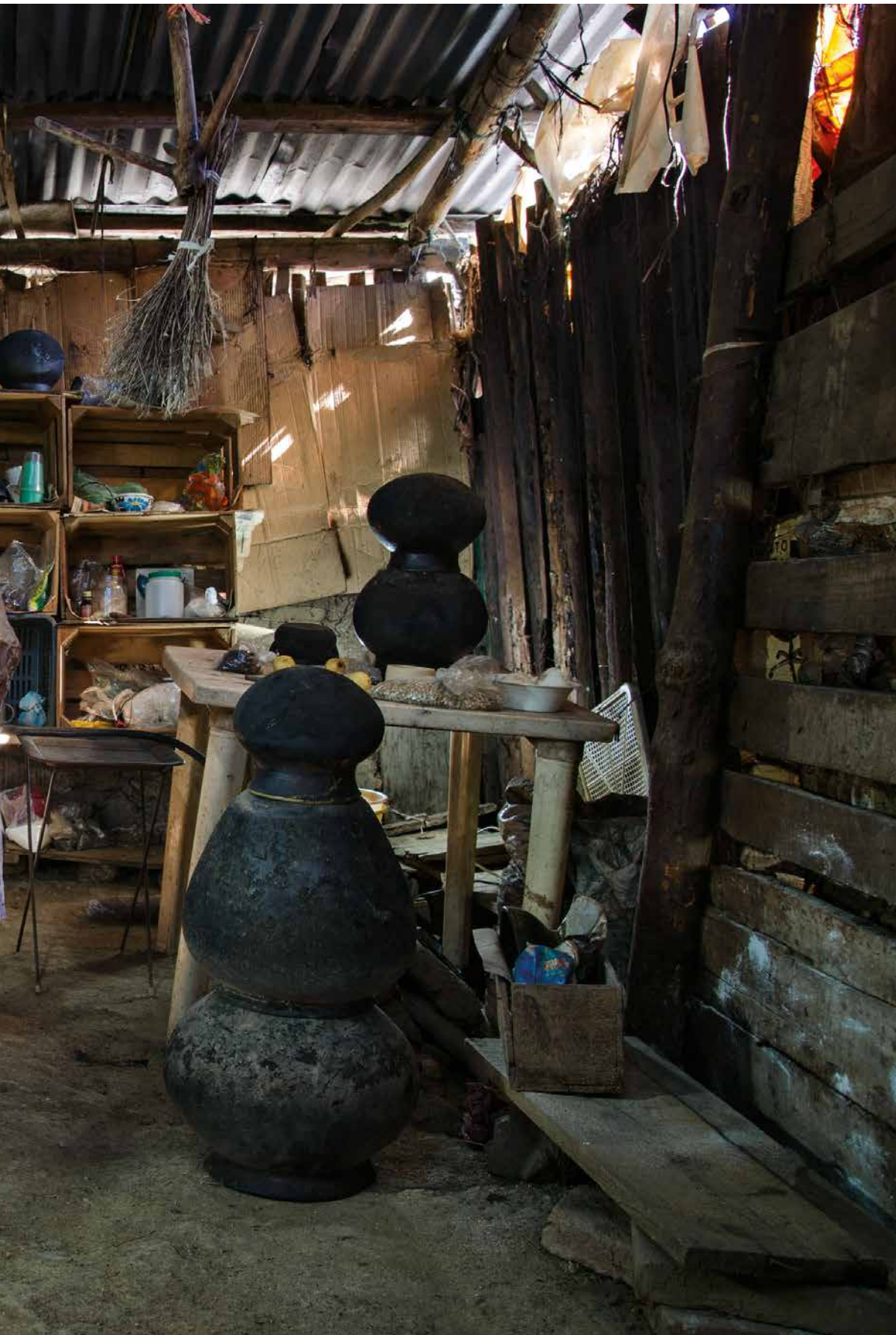
Baldomero Robles, Nolheé yo 'o / Mujer barro , de la serie Loõ litz beë / La casa del viento , San Pedro Cajonos, Villa Alta, Oax.