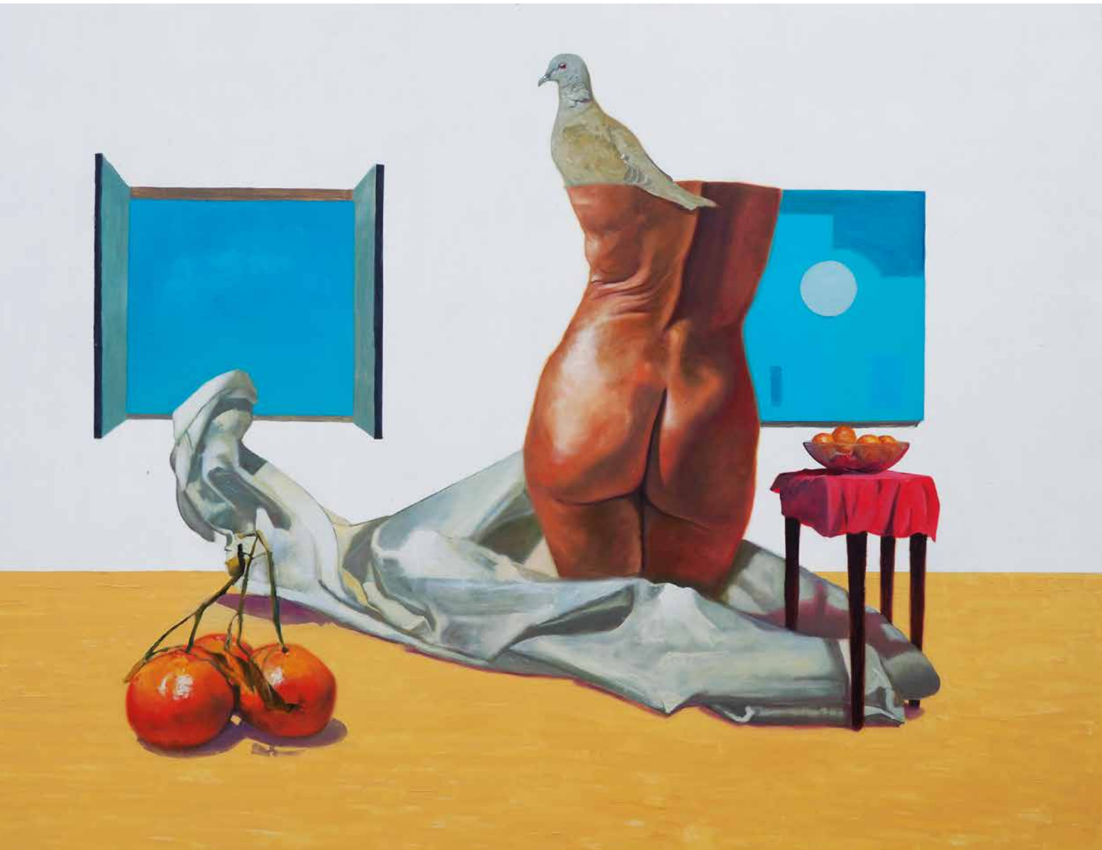
Promesas sobre engaños