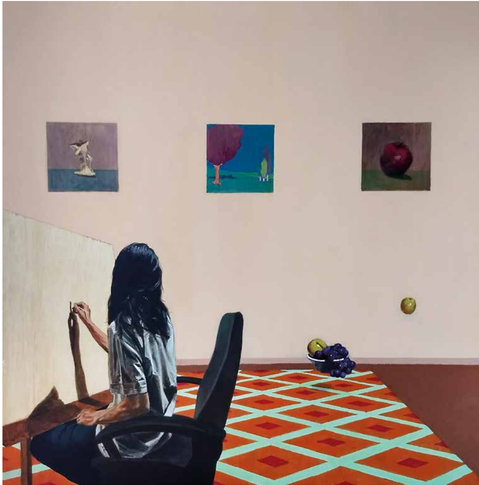
Autorretrato. Memorias, sueños, relatos