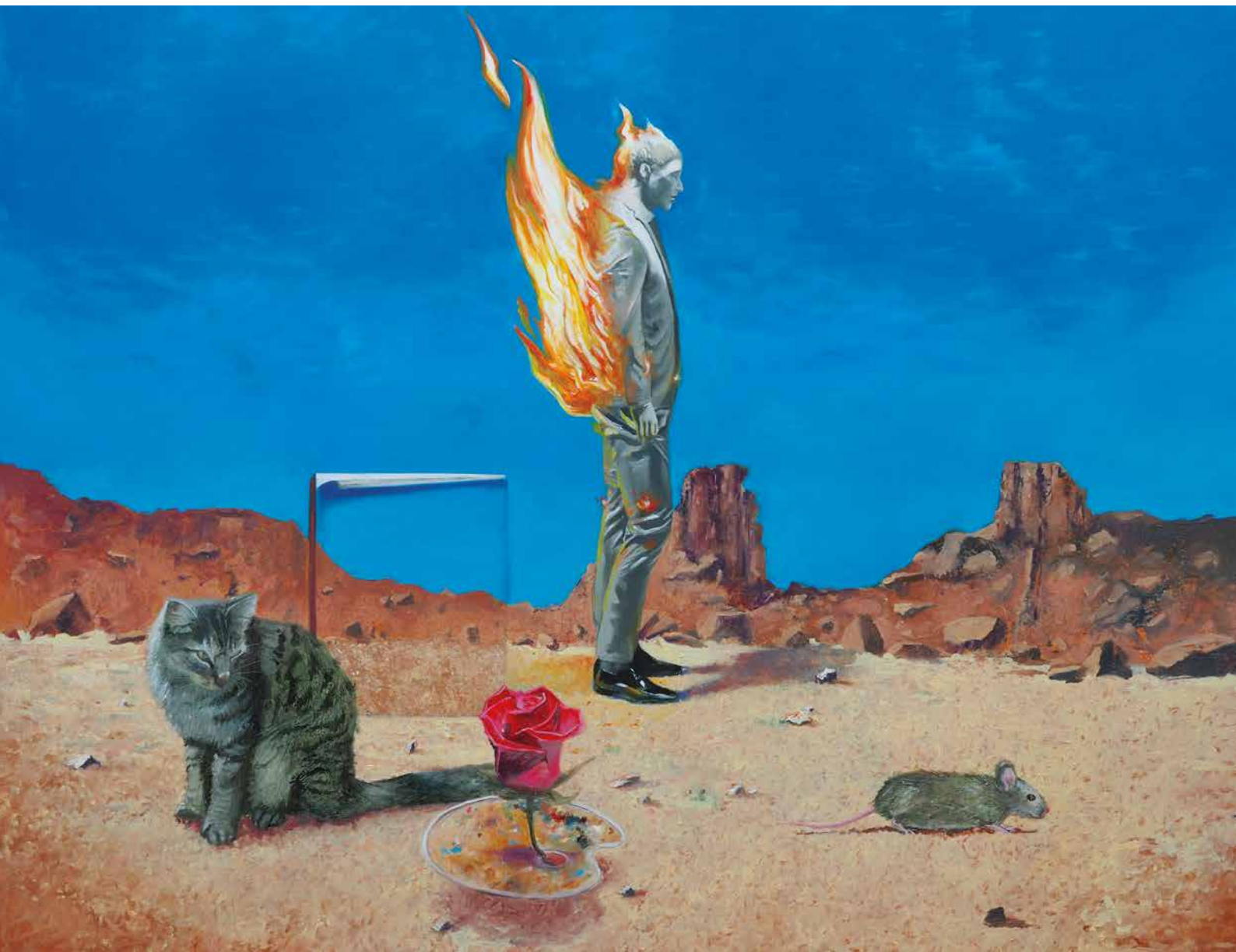
Hombre en llamas