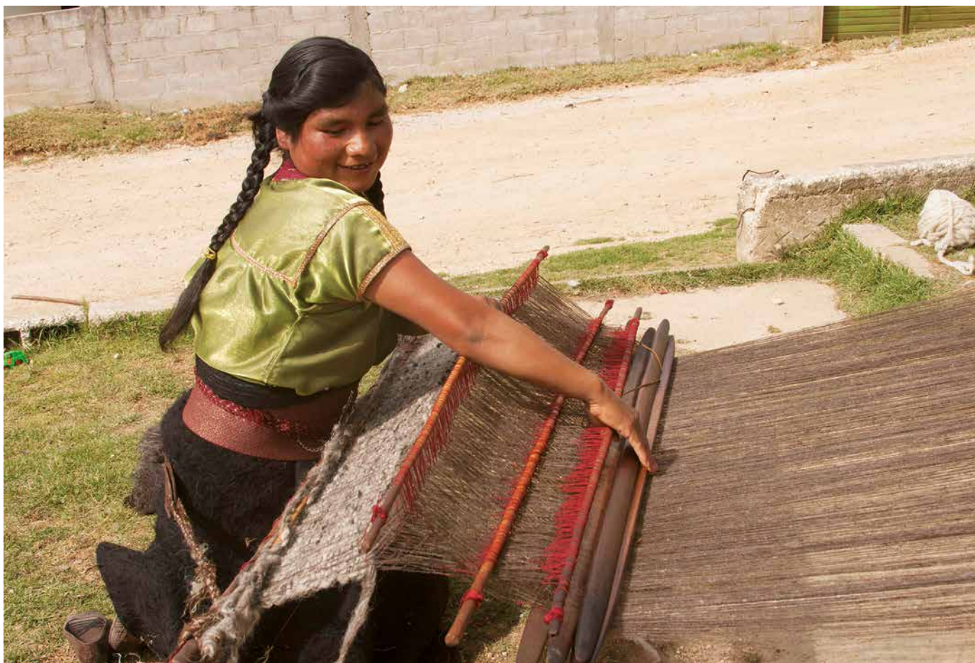
Mujer tejiendo un chuj para hombre. Mide aproximadamente 140 cm de ancho; el largo depende, ya que es para un hombre alto.