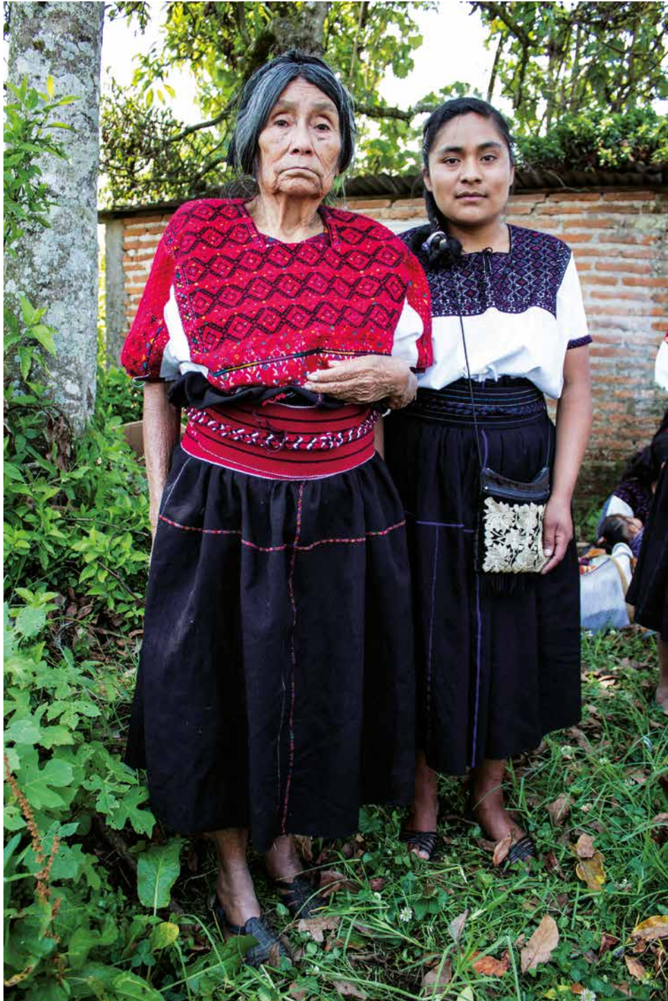
Retrato de la anciana tejiendo memoria con su nieta de cómo va cambiando el tiempo y los colores. San Andrés Larráinzar.