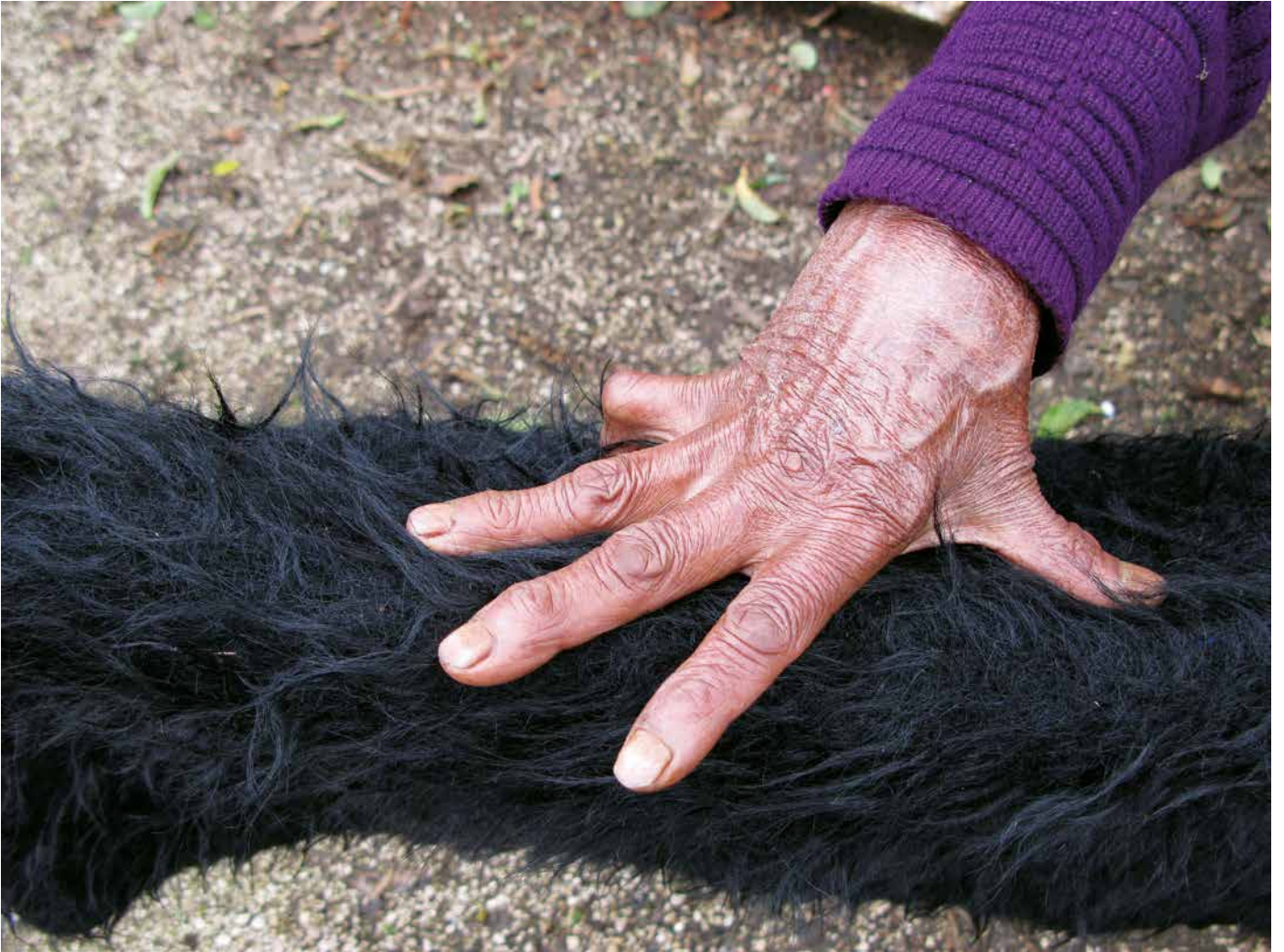
La medida es la cuarta de 20 cm.