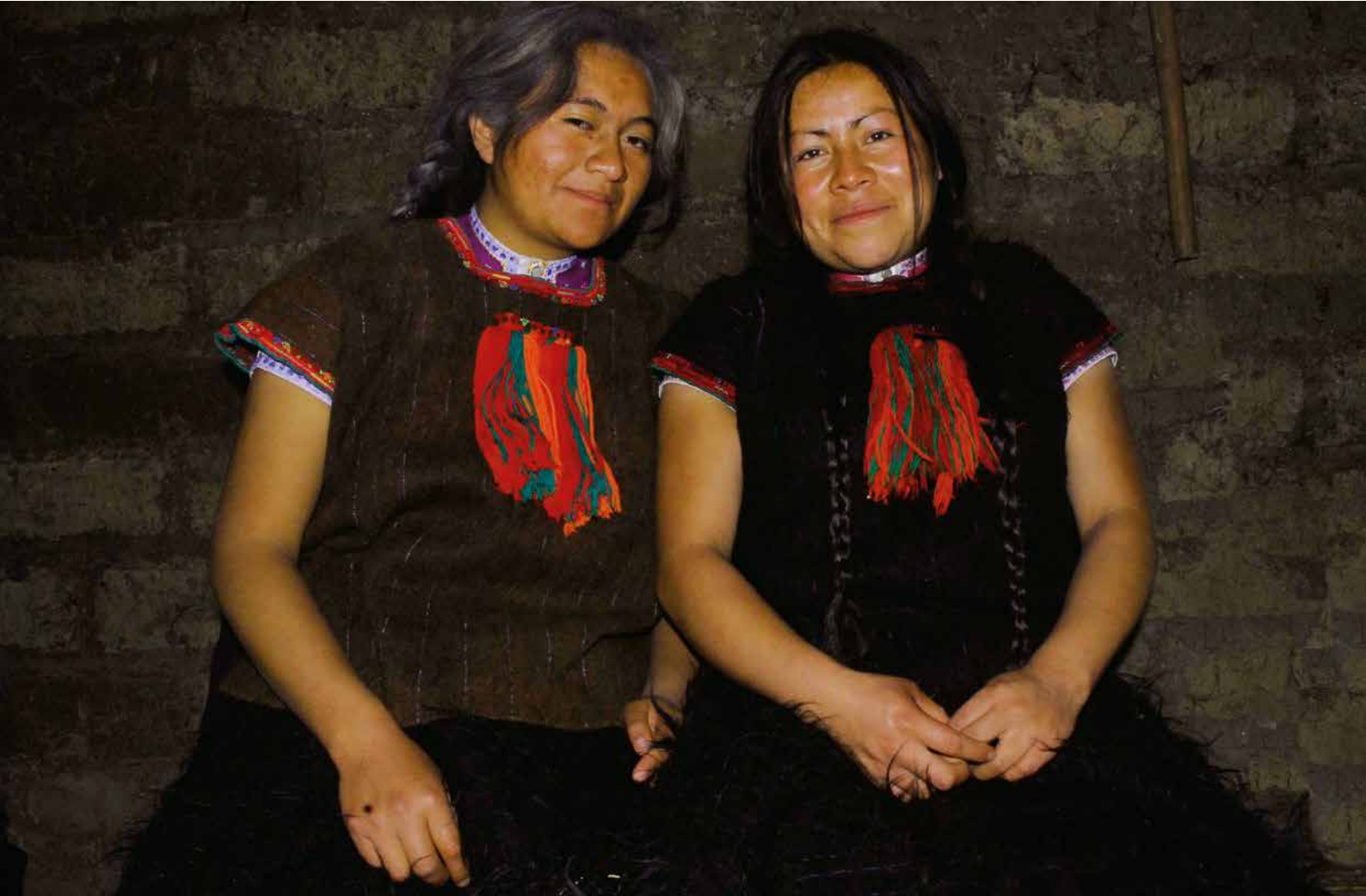
Dos jóvenes vestidas con blusas café de 100% lana de borrego.