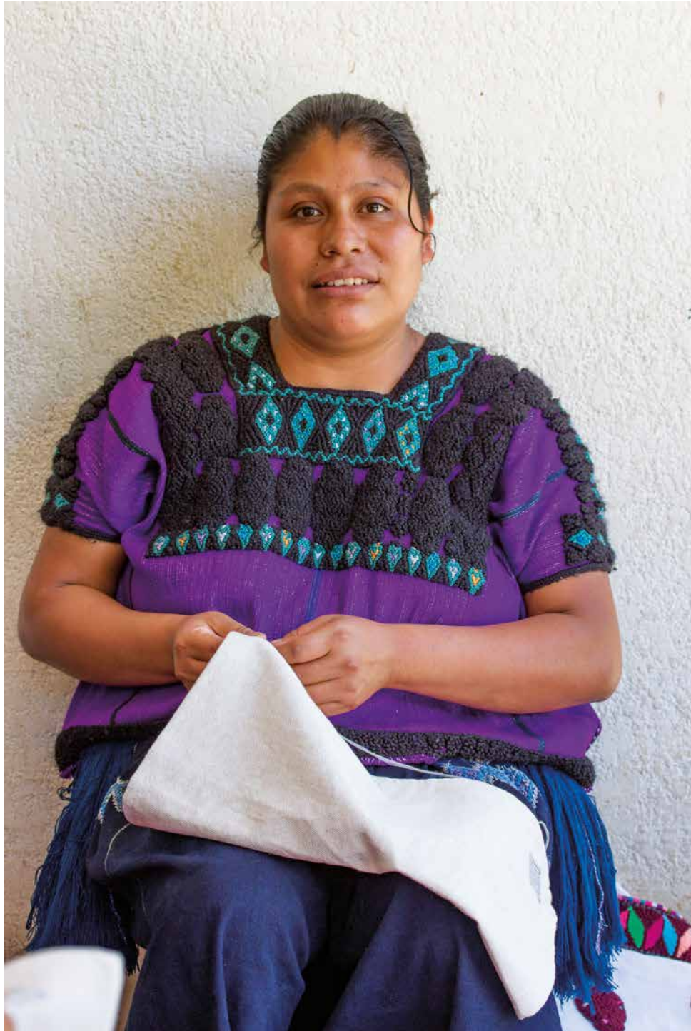
Atuendo del municipio de Chenalhó. Ella bordando sobre tela y pide apoyo para poder comercializar sus artesanías.