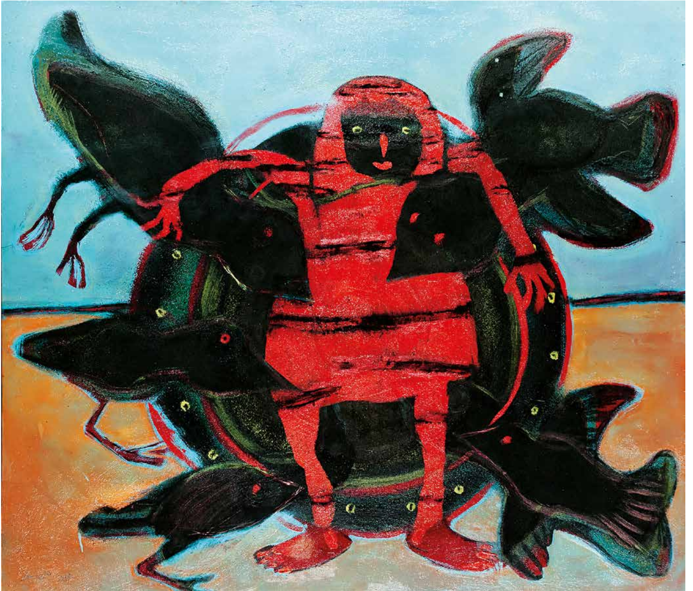
La amiga de las aves, 140 x 160 cm.