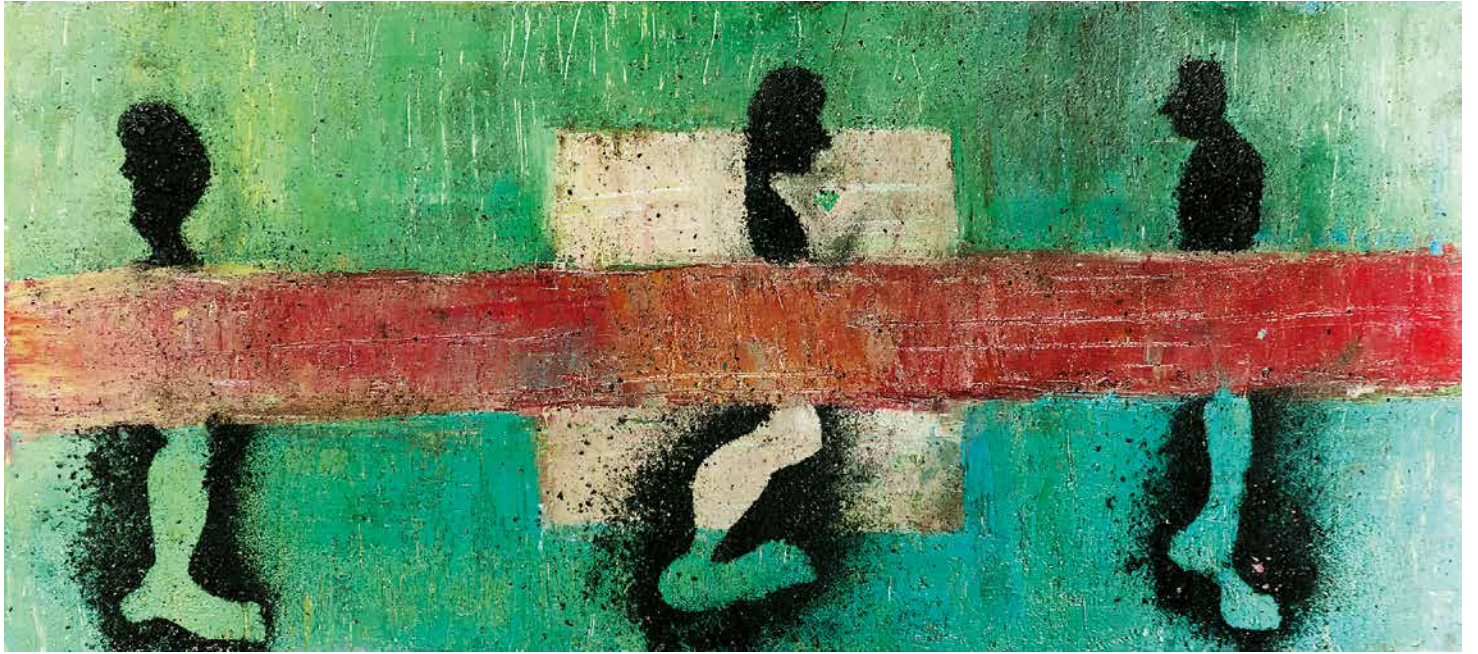
A pie, 30 x 70 cm.