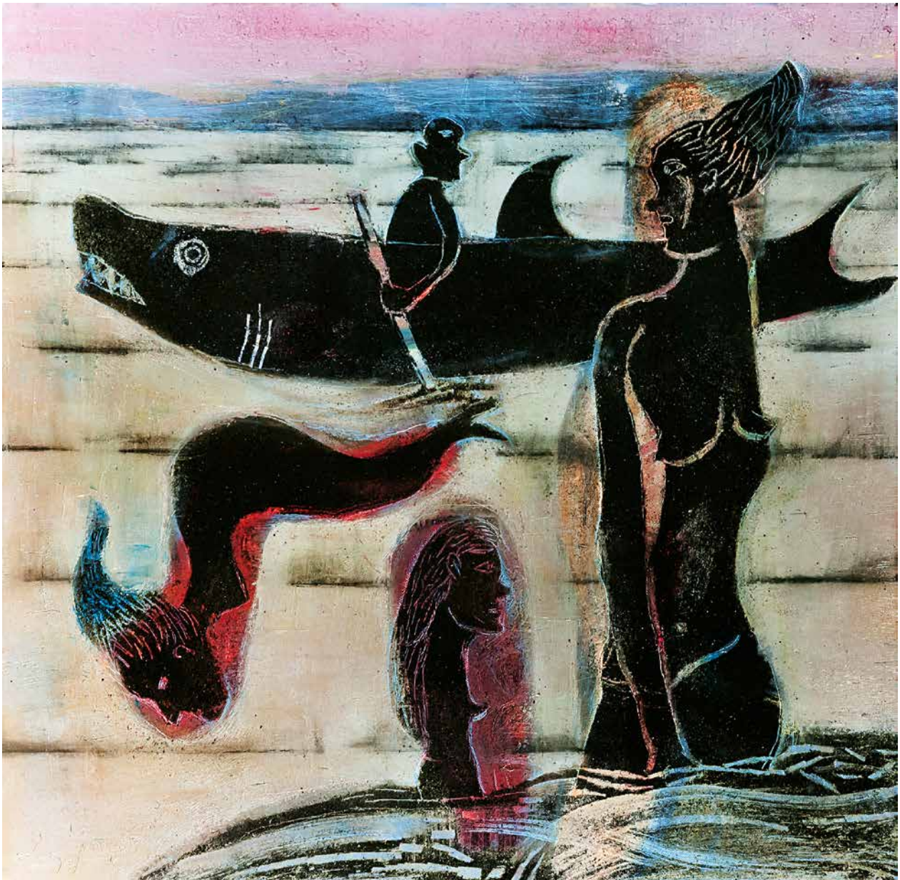
¡Claro que existen!, 80 x 80 cm.