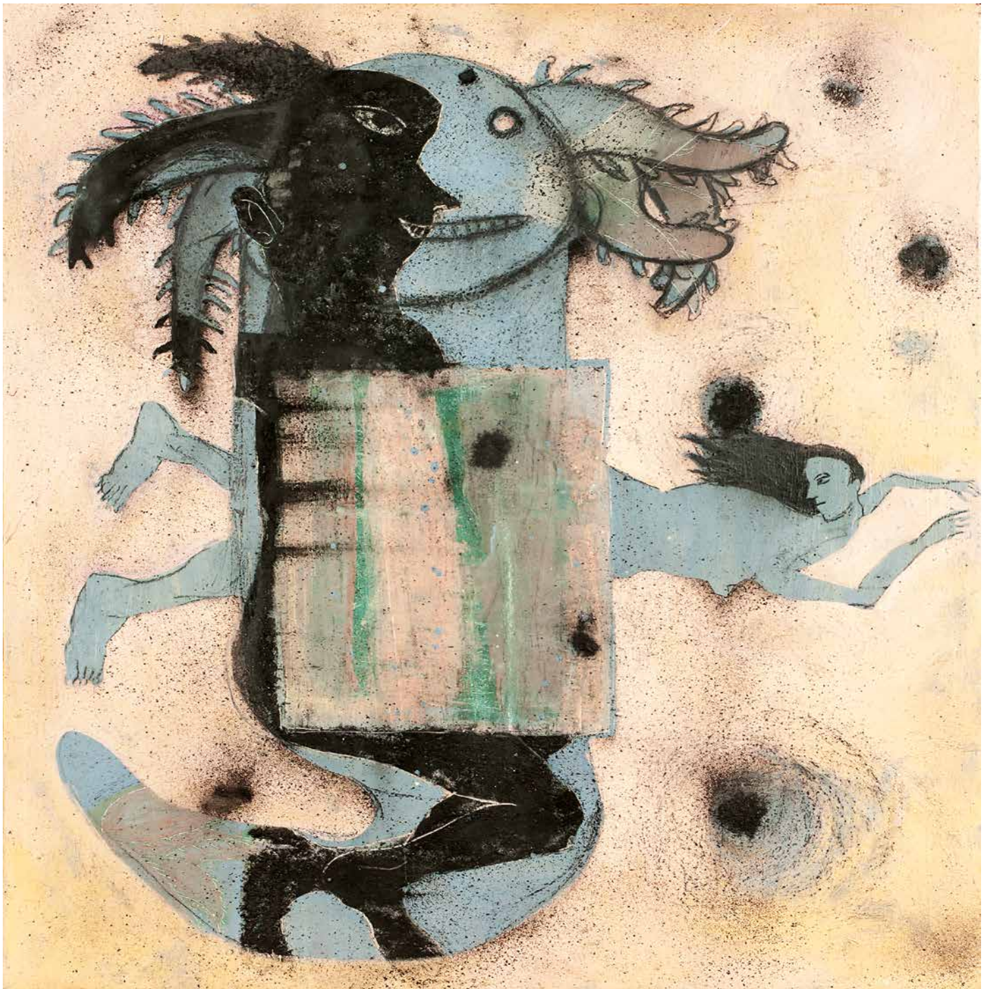
El Axolotlo y ella. 140 x 120 cm.