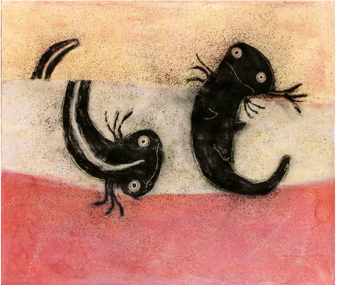
La Axolota y el Axolote, 120 x 140 cm.