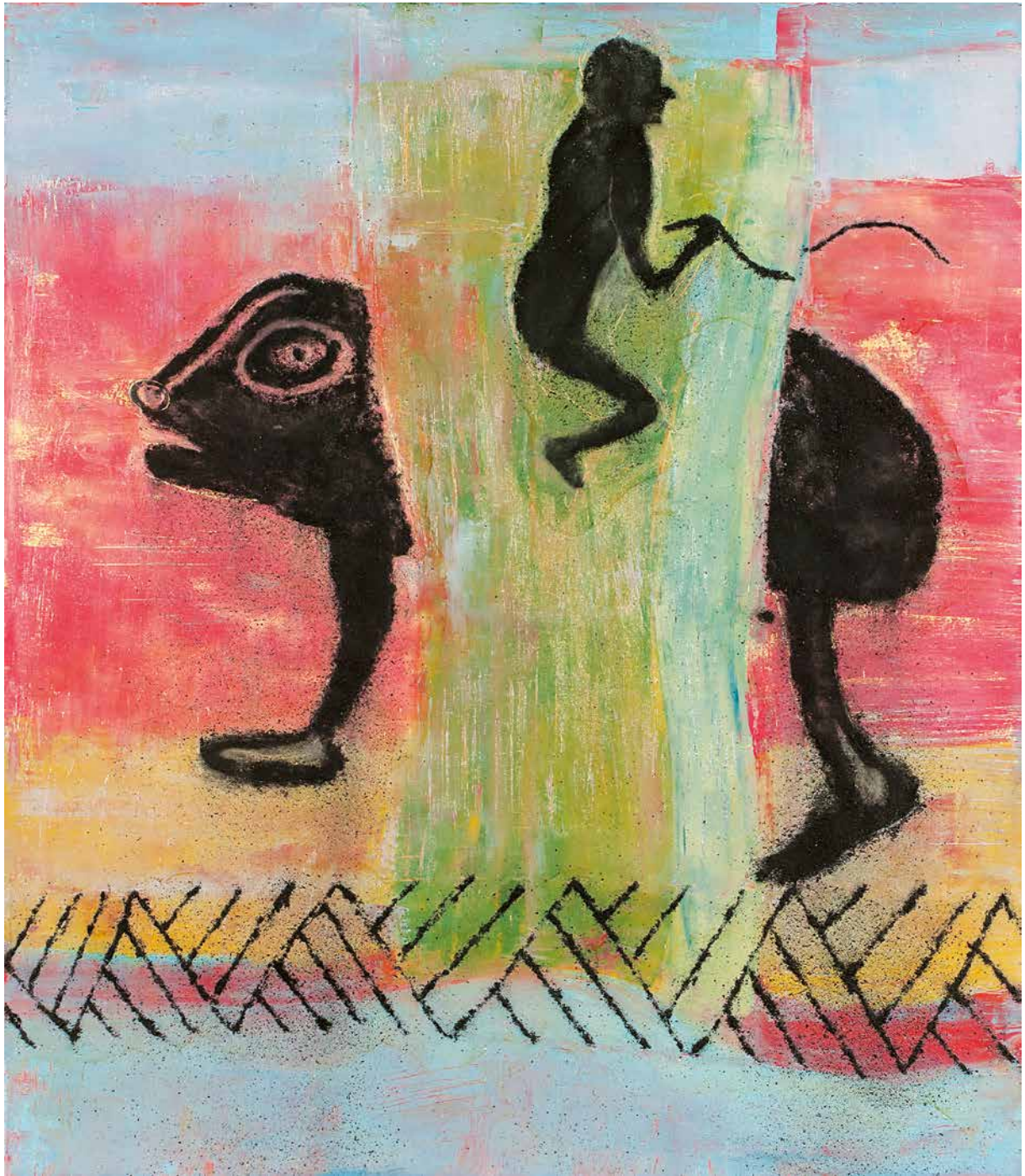
A pelo , 140 x 120 cm.