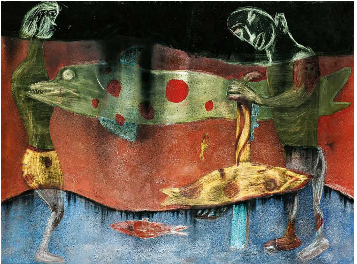
En el mar con bastón, 150 x 200 cm.