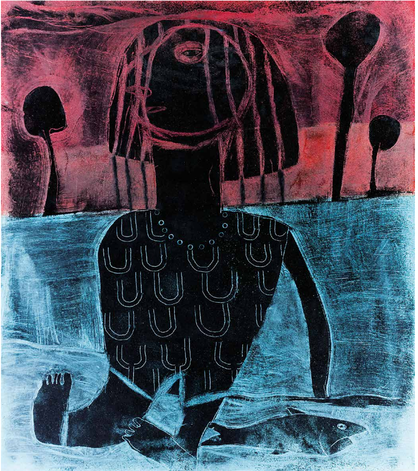
Un pez con ella, 160 x 140 cm.