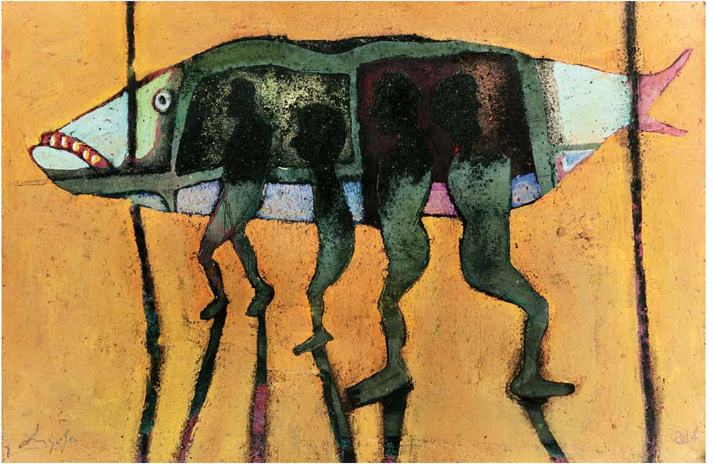
Pez en zancos, 60 x 40 cm.