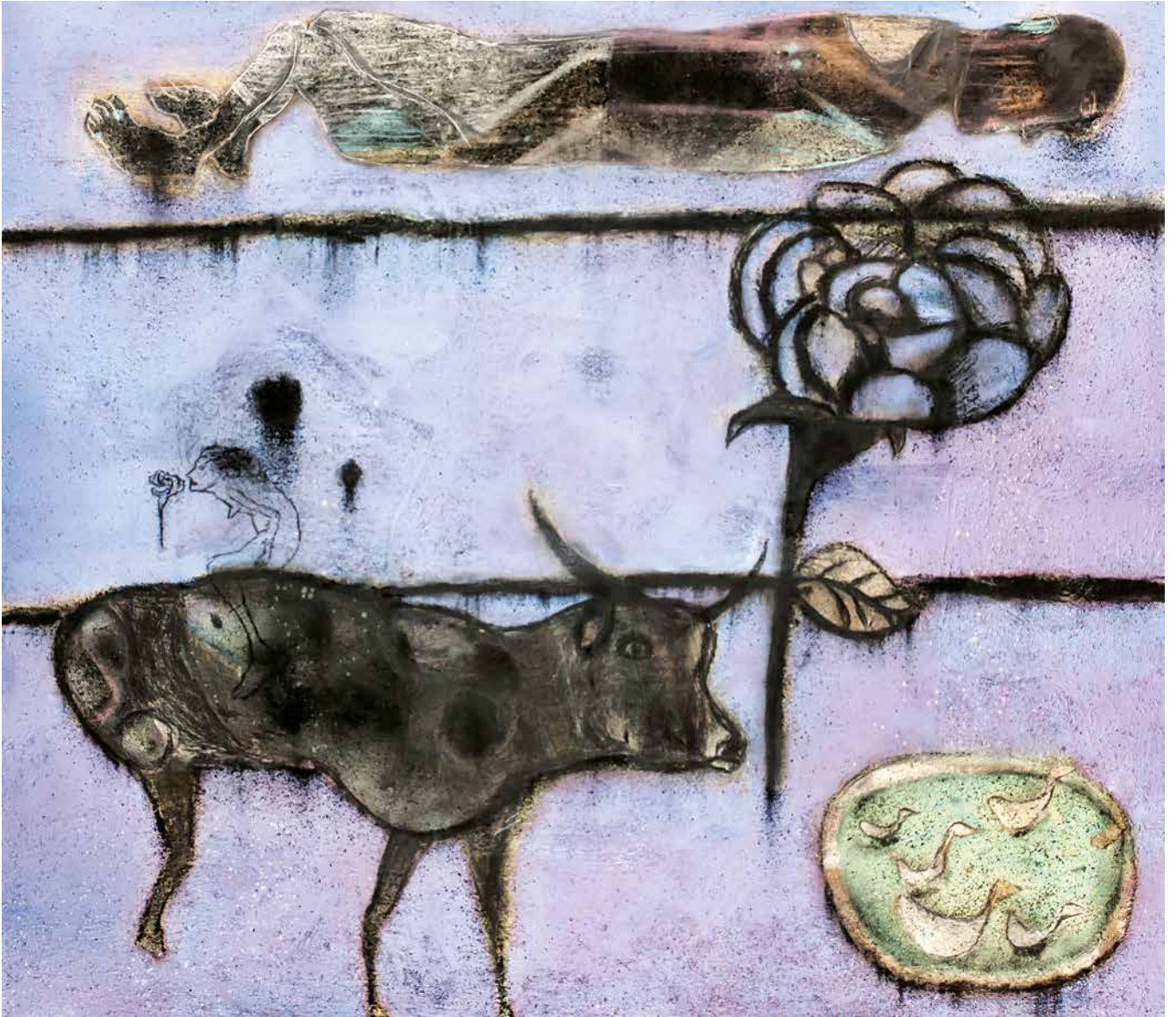
El perfume es violáceo, 140 x 160 cm.