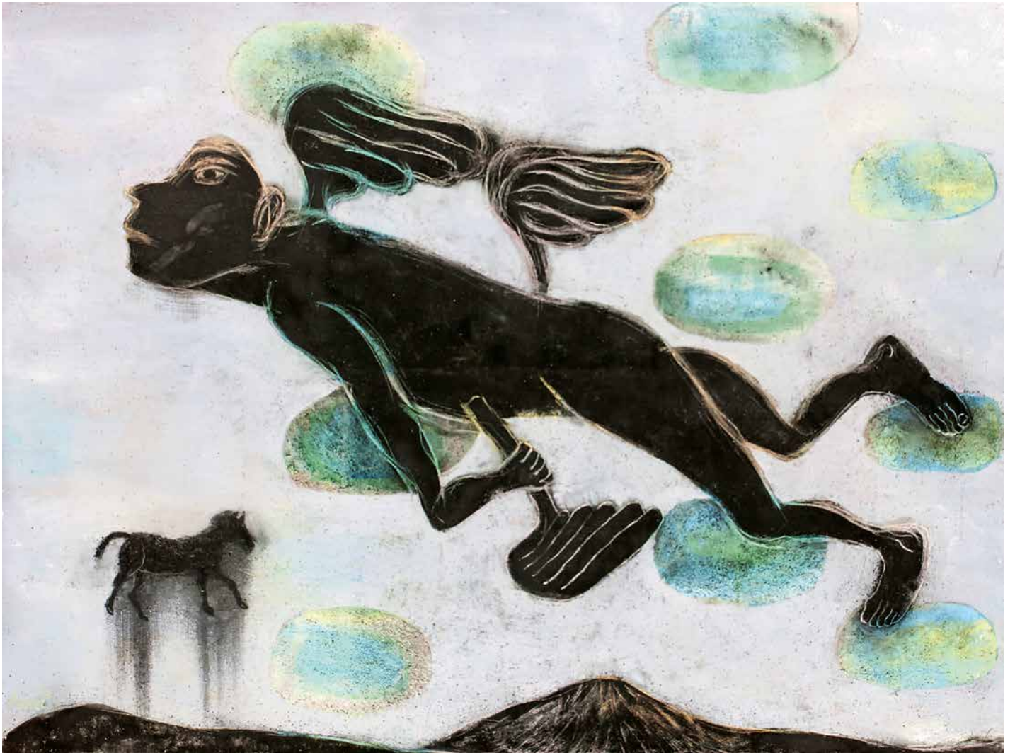
Nubarrones verdes , 150 x 200 cm.