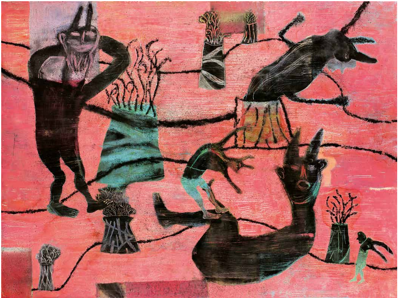
Tierra de volcanes, 150 x 200 cm.