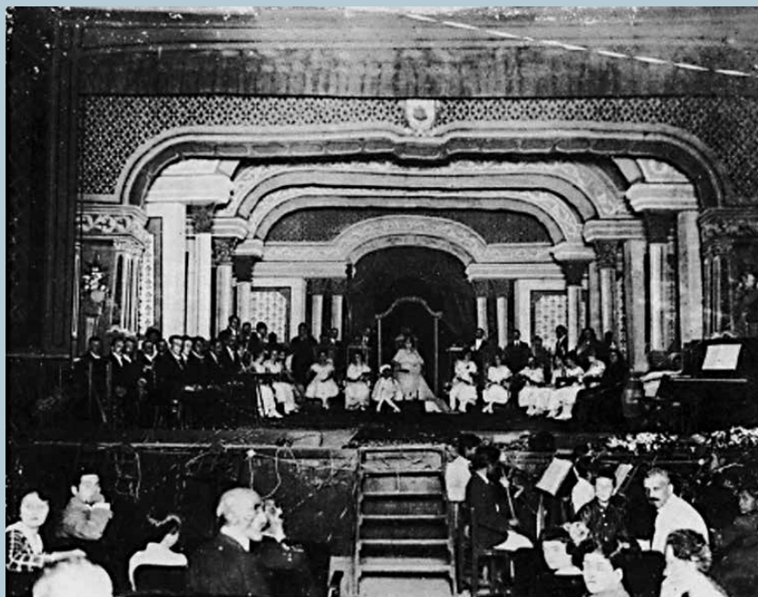
El teatro Lerdo, primer escenario de la OSX. Se encontraba ubicado en la esquina de Clavijero y Altamirano, en la ciudad de Xalapa.

conservó el rasgo de herradura, que recordaba su filiación con los teatros italianos, hasta que fue demolido en la década de los setenta del siglo xx.