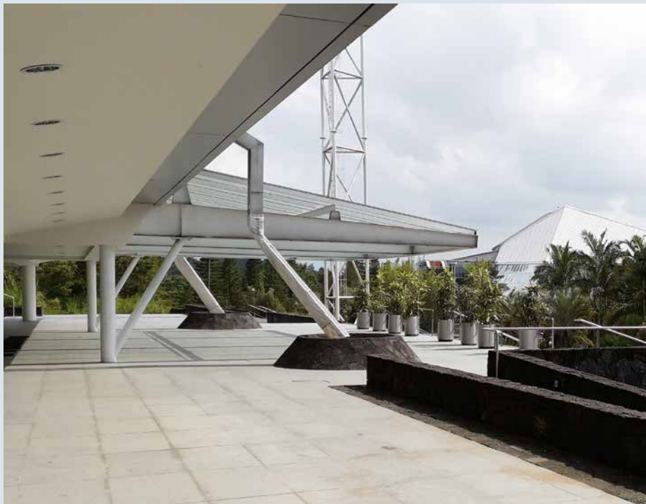
Diferentes perspectivas de la Sala Tlaqná, ubicada en el Campus para la Cultura, las Artes y el Deporte (CCAD) de la Universidad Veracruzana, Xalapa, Veracruz.