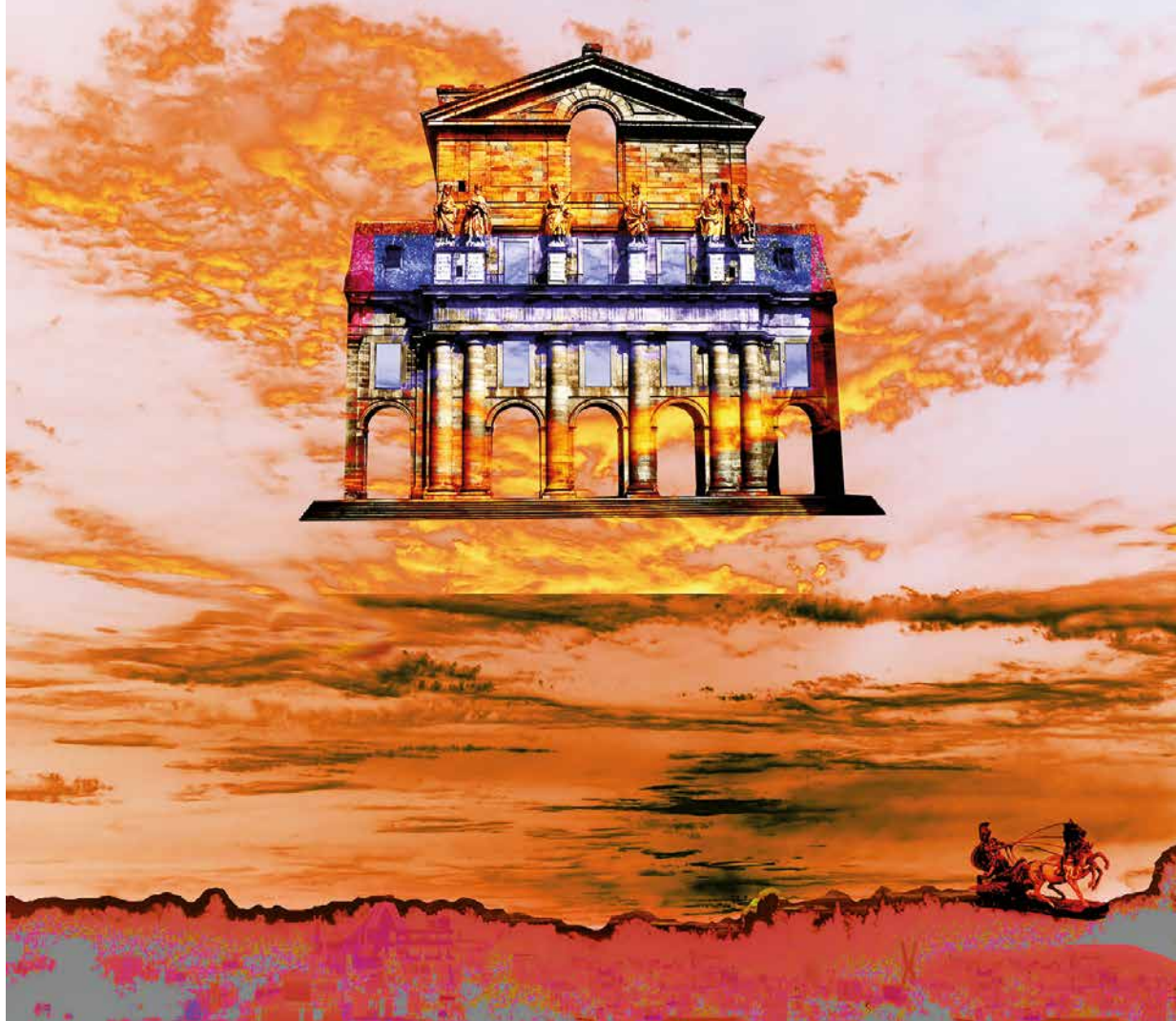
De la serie Viaje silente